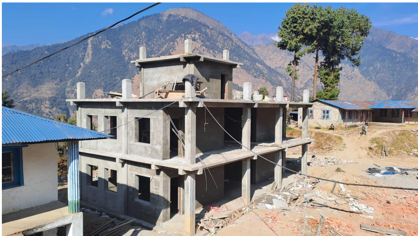
Schulgebäude in Kharikhola, Stand 22.01.2024

Licht für Kinder e.V. in Zusammenarbeit mit dem Berg- und Skiteam jura alpin und der Sherpaadventure Agentur in Nepal